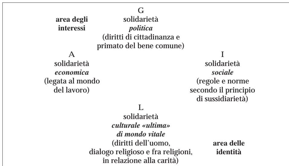
Fig. 3- Forme della solidarietà per la società europea del 2000, come sistema societario allo stesso tempo differenziato e solidale.

Occorre, per questo, che la solidarietà diventi una chiave di lettura fondamentale sia degli interessi che delle identità. E qui il ruolo della dottrina sociale della Chiesa è veramente centrale e cruciale.