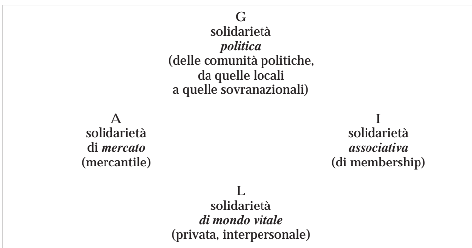
Fig. 1- La differenziazione della solidarietà nel sistema societario.

Ciascuna di queste forme ha il suo proprio codice simbolico e normativo, le sue pratiche, le sue regole. Bisogna quindi saper distinguere la solidarietà economica, quella politica, quella associativa e quella intersoggettiva delle comunità primarie. Sintetizzo tutto ciò nella fig. 1 12 .